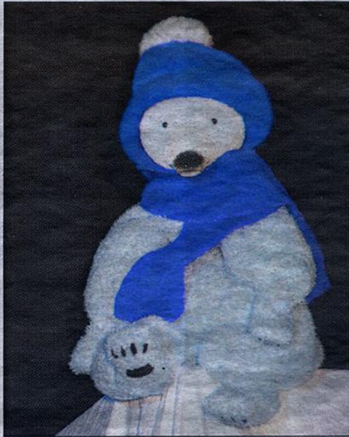
Der putzige Ika ist Hauptfigur des Theaterstücks „Auch Eisbären können frieren“.

Das Stück und seine Figuren sind ganz auf die Kinder zugeschnitten. „Bei Kindern kann man noch etwas bewegen.“ Bestärkung und Nahrung sollen Ika und seine Geschichte für die kleinen Menschen sein. „Durch die Hingabe der Kinder lerne ich immer wieder aufs Neue das Spielen,“ beschreibt sie ihre Motivation. Zusammen mit der Regisseurin Hendrikje Winter und dem Musiker Martin Lücke übt die Jung-Künstlerin die Abläufe ein, denn die Umbauten werden alle auf der Bühne